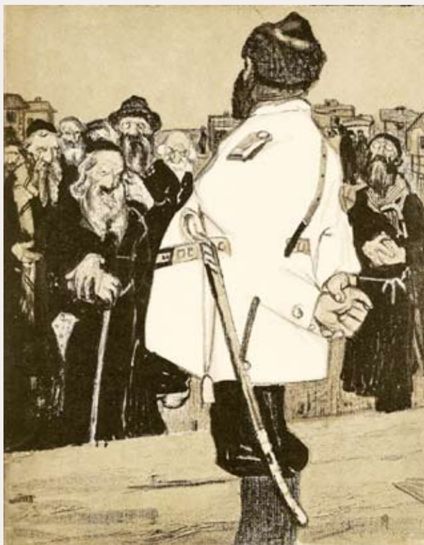
Карикатура в журнале Jugend 1912 №19 «Из России. Думаете, нам государственным служащим легко? Вчера только одного чуть не арестовали из-за каких-то 100000 рублей»