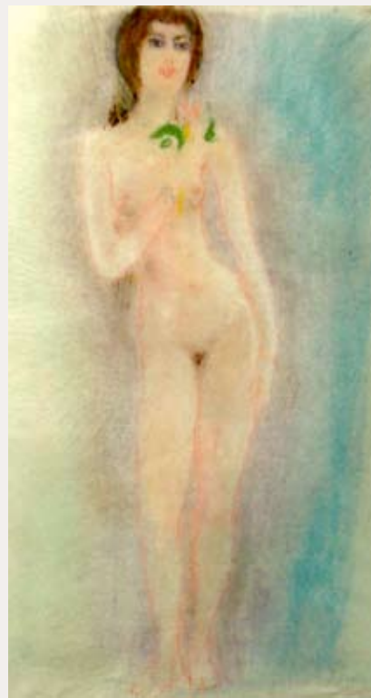
Девушка с цветком. 1920-е. Тонкая бумага, пастель. 61 × 46. Собрание А. Родионова (СПб)

В 1943 г. Роберт Генин покончил жизнь самоубийством в своей московской мастерской. Причины такого решения нам неизвестны, однако легко предполагаемы. Многим «возвращенцам» была тогда уготована на родине печальная судьба. Имя и творчество художника были надолго преданы забвению, а судьба оставшихся в его мастерской работ до сих пор остается неизвестной. В многотомном библиографическом Словаре «Художники народов СССР», издание которого началось в 1970 г. и, кажется, продолжается до сих пор, среди нескольких тысяч малоизвестных имен места для Роберта Генина не нашлось (как, впрочем, и таким корифеям, как Александр Архи-