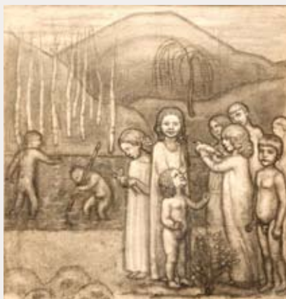
Дети у водоёма. До 1919. Б., кар. 46 × 43 Собрание А. Родионова (СПб)

в небольшом городке Асконе на берегу озера Маджиоре — излюбленном месте художников (там же одновременно обосновалась и М. В. Веревкина, вокруг которой сплотился кружок местных живописцев «Большой медведь» — Der Grosse Bär); зимние месяцы проводил в Берлине (до 1927 г.) или в окрестностях Парижа. Он плодотворно работал как живописец и график: писал лирические портреты и пейзажи, создавал графические серии заостренной социальной направленности, выпустил альбомы и портфолио «Люди» 9 , «Цирк» 10 , «Типы берлинских притонов» 11 , исполнил иллюстрации к книгам «История графа Эрдмана Промница» Я. Вассермана (1921, 9 офорт), «Die Engel mit dem Spleen» К. Эдшидта (1923; 12 литографий) и «Симфония „Песнь о Земле“