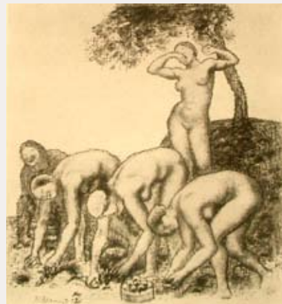
Работницы в поле. 1912. Литография. 22 × 20. Лист №15 из альбома «Фигурные композиции» (20 листов), 1912, Мюнхен, изд. «Дельфин», тир. 140 экз.